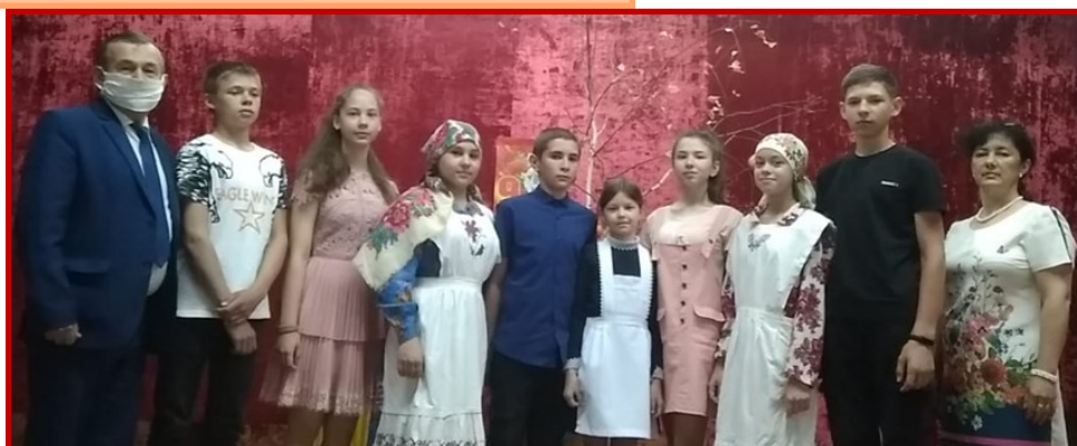
Бөек Жиңүнең 76 еллыгына