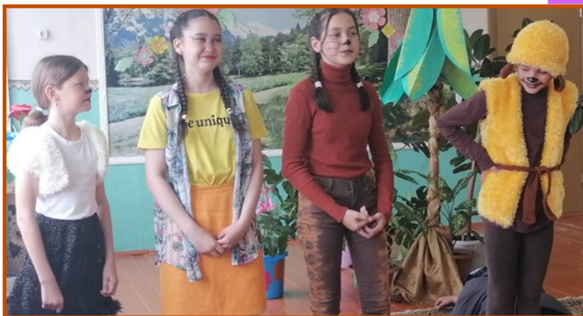
"Үзем белән үзем"